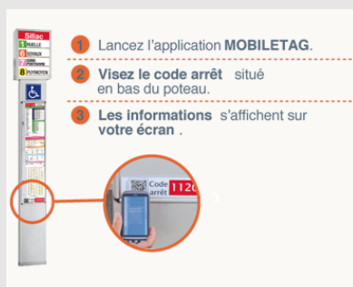
QRcode au poteau

Après avoir téléchargé au préalable une application de lecture de QR Codes (« flashcode » par exemple), vous connaîtrez instantanément les horaires en temps réel de toutes les lignes passant à un arrêt. Il vous suffit d'ouvrir l'application, de scanner le QR code présent sur chaque poteau d'arrêt et de suivre les indications. Les horaires réels des lignes s'afficheront immédiatement sur votre écran (photo ci-dessous).